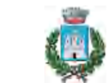
Comune di Castiglione della Pescaia

La destination touristique de la Maremma Toscana Area Nord est composée de :